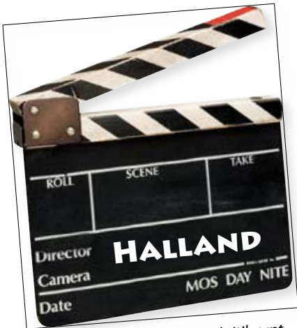
Halländsk film får lysande kritik runt om i världen.

"A new kind of cinema grows before our eyes..."